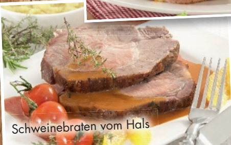
Schweinebraten vom Hals