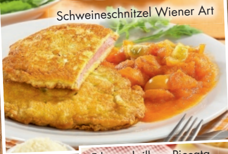
Schweineschnitzel Wiener Art