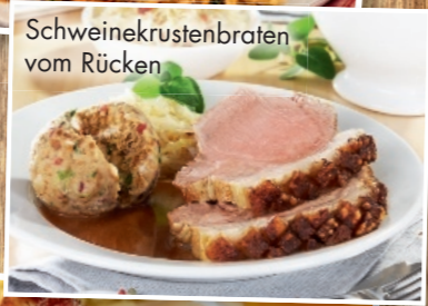
Schweinekrustenbraten vom Rücken